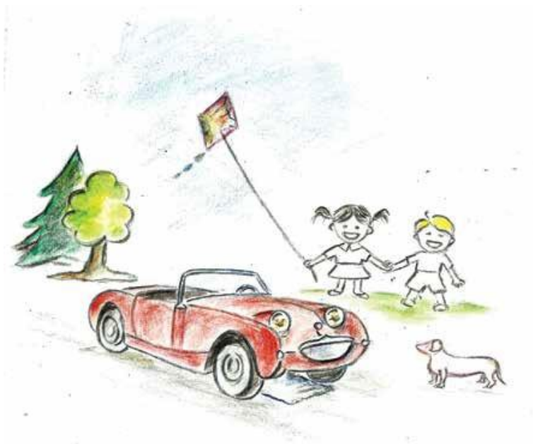
Ihr Fahrzeug – ein Hingucker für Jung und Alt.