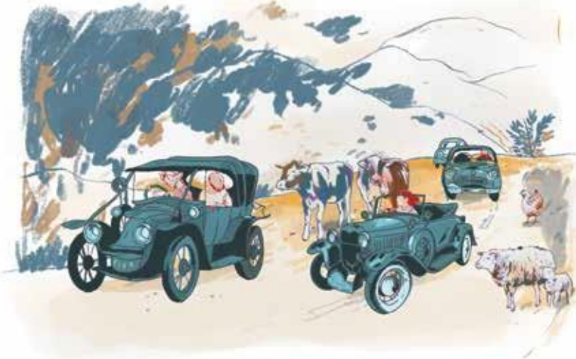
Sie lenken den Fahrer weniger ab als ein modernes Fahrzeug, aber die Blicke der Passanten auf sich.