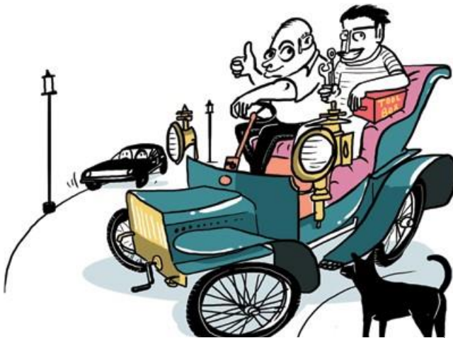
Ihre besten Reisebegleiter: Beifahrer und Bordwerkzeug.

Finden Sie daher bitte einen vernünftigen Kompromiss zwischen Modifizierung des Fahrzeugs und bestmöglicher Erhaltung des Originalzustands – sicher und sparsam.