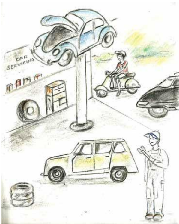
Häufige Inspektion und Wartung sind wichtig!