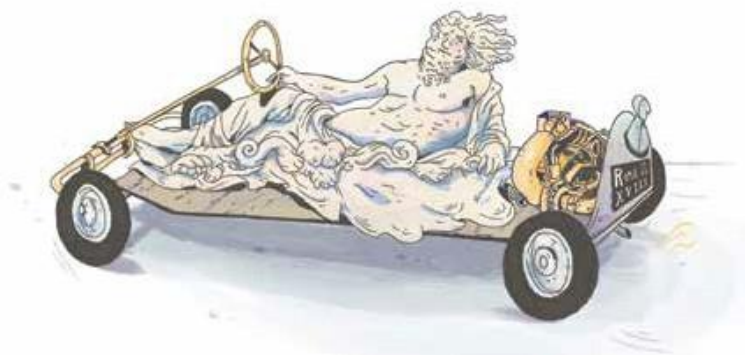
Ein rollendes Museum.

Historische Fahrzeuge repräsentieren die Geschichte der Mobilität, der Technik und des Designs. Sie wurden nicht dafür gebaut, die Standards von heute zu erfüllen. Historische Fahrzeuge zeugen von der technischen Entwicklung von den Anfängen bis heute und geben uns ein besseres Verständnis von der technischen und kulturellen Entwicklung der Mobilität. Die Eigentümer historischer Fahrzeuge sind die Hüter des „rollenden Museum“ auf der Straße. Mit den komplexen Fragen rund um Umwelt- und Klimaschutz und den damit verbundenen Herausforderungen insbesondere für Städte sind sie bestens vertraut. Die FIVA hat sich den anhaltenden Respekt der Gesellschaft für ihre Arbeit verdient: Sie führt vor Augen, wie wichtig die Erhaltung historischer Fahrzeuge ist, und präsentiert sie einem breiten Publikum. Damit das so bleibt, ist es äußerst wichtig, dass jeder Eigentümer eines historischen Fahrzeugs umsichtiges und verantwortungsvolles Verhalten an den Tag legt, wenn er mit seinem Fahrzeug unterwegs ist – in der Öffentlichkeit und auf Privatgrund.